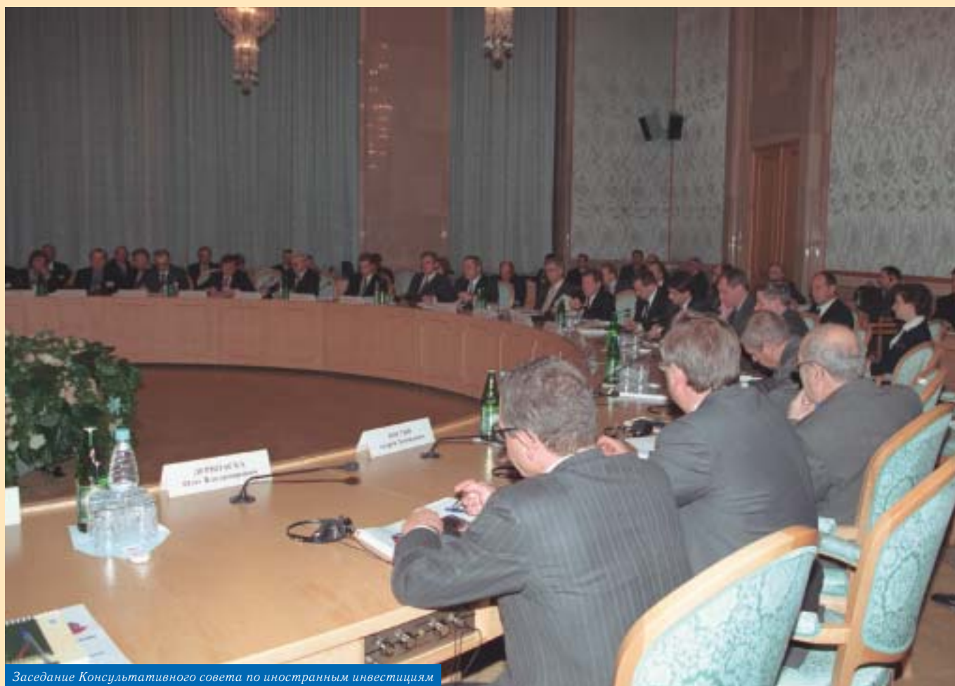
Заседание Консультативного совета по иностранным инвестициям

Российское правительство добилось впечатляющих результатов в деле улучшения инвестиционного климата в России. Изменения в законодательстве 2002-2003 гг., усилия Правительства по внедрению принципов корпоративного управления привели к решительному изменению отношения к российской экономике, выразившемуся в реализации крупных инвестиционных проектов с участием иностранных инвесторов в 2003 г. Участники рабочей группы поддерживают усилия Правительства и надеются на их продолжение. Создание благоприятного инвестиционного климата предполагает дальнейшие усилия по совершенствованию законодательства, правоприменения и обучению. Меры по развитию рынка капитала как основы для повышения роли корпоративного управления станут, в конечном итоге, основой повышения